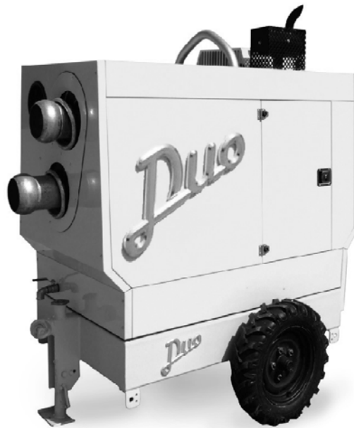
JM 6-250 DUO Silenziato

Le pompe vuotoassistite sono gruppi che utilizzano una pompa per vuoto (depressore) per accelerare l'innescamento, cioè, la fase iniziale del pompaggio in cui bisogna togliere l'aria dalla condotta d'aspirazione per fare arrivare il liquido nella pompa.