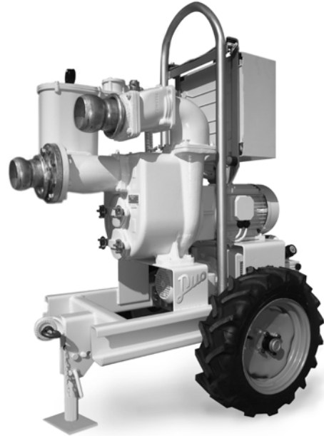
JE 6-250 DUO