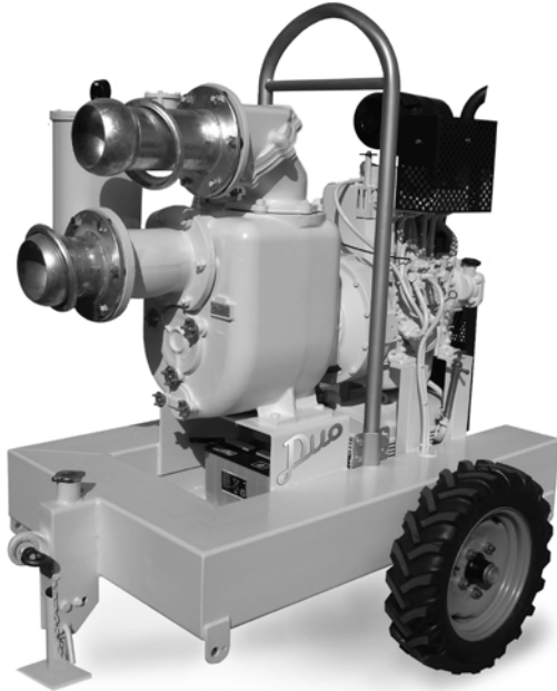
JM 6-250 DUO